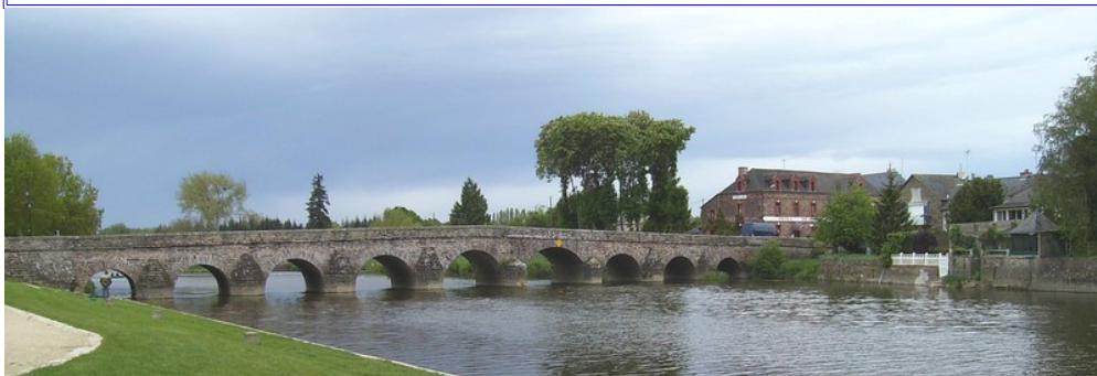
Pont-Réan : pont en pierres de schiste rouge violacé du XVII e siècle

➤ 5 e étape <<< Rennes :: Pont-Réan >>> 19,5 km 4h50