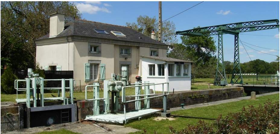
Bruz : écluse avec pont-levis de Cicé

À quelques kilomètres, enchâssé dans un défilé de schiste pourpre, le moulin du Boël (XVII e siècle) attire de nombreux visiteurs tant pour sa présence dans ce site exceptionnel que pour la qualité de sa construction qui lui fait tenir tête imperturbablement, et depuis des lustres, aux plus fortes crues de la Vilaine.