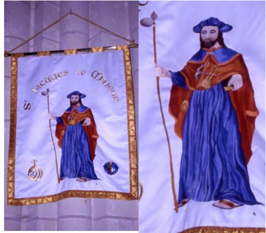
La Planche (44)

° A l'église Saint-Jacques de La Planche (44), la bannière la plus récente présente le saint coiffé d'un chapeau genre « béret », les pieds chaussés de sandales ; il porte une robe très ample, un manteau retombant devant sa poitrine et un mantelet. Un livre dans la main gauche, il tient dans la droite un grand bâton muni d'une gourde. Inscription au dessus de sa tête : « S' Jacques le Majeur »