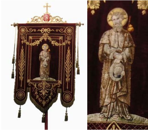
Nantes – Pirmil (44)

° Sur l'une des deux bannières de l'église Saint-Jacques de Pirmil, à Nantes (44), saint Jacques est tête nue auréolée, les pieds nus. Il est vêtu d'une robe et d'une redingote au large col rabattu formant mantelet. Il tient des deux mains son chapeau devant lui, un grand bourdon reposant dans la saignée du bras gauche.