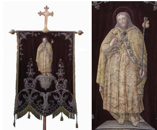
Nantes – Pirmil (44)

° Sur l'une des deux bannières de l'église Saint-Jacques de Pirmil, à Nantes (44), saint Jacques est tête nue auréolée, les pieds nus. Il est vêtu d'une robe et d'une redingote au large col rabattu formant mantelet. Il tient des deux mains son chapeau devant lui, un grand bourdon reposant dans la saignée du bras gauche.