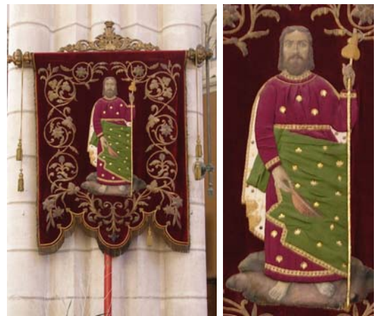
La Planche (44)

° L'église Saint-Jacques de Locquirec possède une bannière de procession à l'image de saint Jacques. Le saint, tête nue auréolée, est vêtu d'une robe « à fleurs » et d'un grand manteau formant mantelet orné d'une coquille. Il tient un livre à la main gauche et un mince bourdon avec gourde à la main droite. Il semble planer sur un nuage.